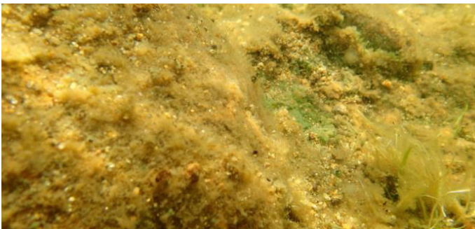
Périphyton fixé sur des roches

la rive et par l'apport en phosphore. Si un apport externe survient dans le lac, il atteint d'abord la zone près des rives. La mesure de l'épaisseur du périphyton dans la partie peu profonde du lac est donc considérée comme premier indicateur de la détérioration d'un système lacustre (Lambert, et al., 2008).